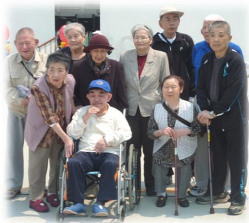
みんなで記念撮影♪