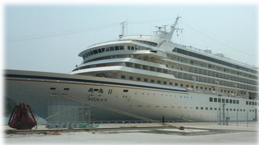
豪華客船「飛鳥Ⅱ」とても大きいですね。

今年初の日帰り旅行の行き先は大船渡市でした。 大船渡湾で豪華客船「飛鳥Ⅱ号」を見て来ました。 久しぶりの外出でしたが、美味しい昼食と道の駅さんりくで 買い物をして楽しい旅行となりました。 次回の旅行もどこに行くか楽しみです。